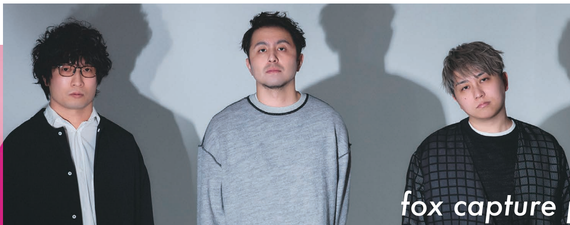
fox capture plan