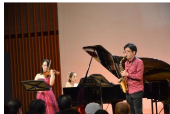
▲令和5年度開催「撮影サポーター写真展」より（写真は令和4年度グランシップ公演のもの）

撮影部門サポーターがカメラに収めた数々のグランシップ公演記録から、厳選した写真を紹介します。今年はグランシップサポーター レセプション・広報部門の活動の様子や、撮影部門サポーターの個人作品など、サポーターについて知ることができるコーナーも。