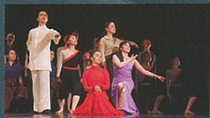
2009.11.1 第24回国民文化祭「しずおか2009」 モダンダンスの祭典 (磐田市民文化会館)