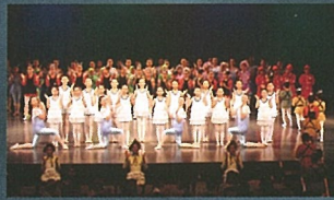
2012.8.26 静岡県・浙江省友好提携30周年記念 日中児童舞踊公演「明日にむかって走れ!」 (磐田市民文化会館)