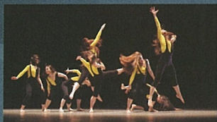
2015.3 静岡県現代舞踊協会公演 「モダンダンス 舞あそぶ」(グランシップ中ホール)