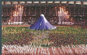
2003.10 NEW!!わかふじ国体秋季大会 開会式典前演技 (静岡スタジアム エコパ)