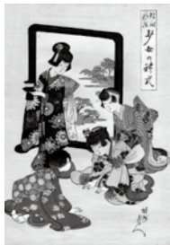
「現時風俗少女の礼式」