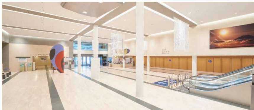
1階ロビーでは「Art@東静岡」を定期開催。9/22(水)からは美術家 千葉広一氏の作品を展示。

ロビーやライブラリー、カフェ…。館内の空間が織り成す「ひととき」も文化施設ならではの、気軽に思い思いの時間を過ごしてみませんか。