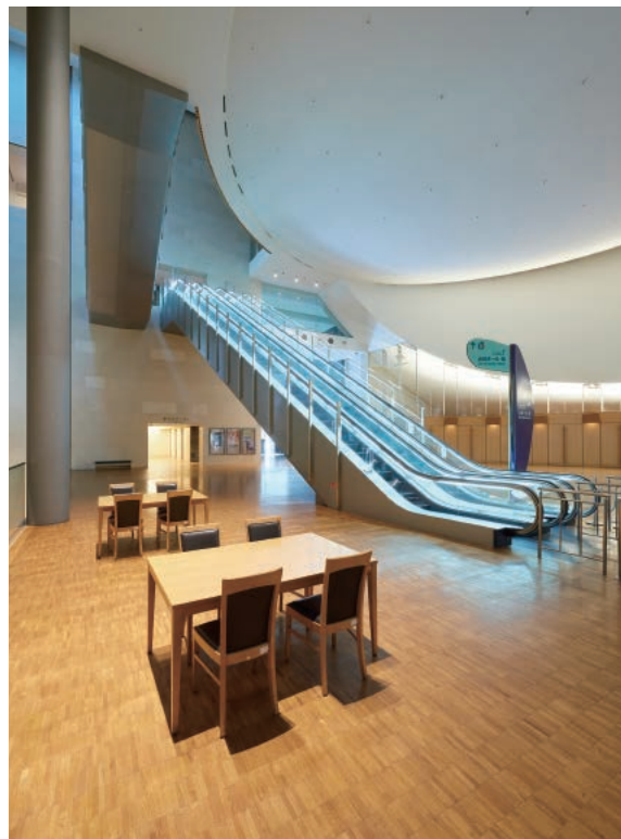
館内でもひとときわ個性的な3階ロビー。天井が高く、開放的な気分。