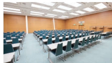
300人収容の大会議室はカーペットを新調。