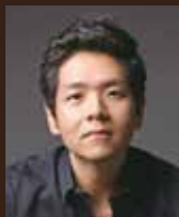
セイル・キム(テノール)