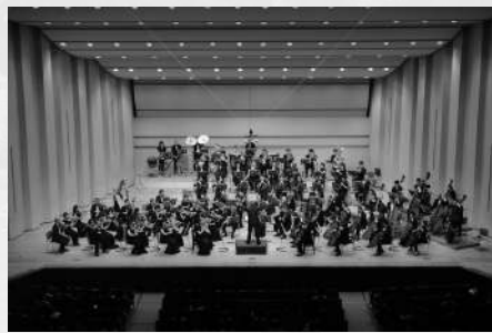
現在団員数90名 URL: http://shizphil.net

1977年9月に静岡市を中心とする音楽愛好家が集まって創立され、定期演奏会を軸に年3-5回の演奏活動を行なっています。これまでの延べ公演回数は180回を超え、この間、1986年8月の中国公演(北京音楽庁、杭州劇院)を皮切りに、1989年米国(オマハ、ボストン)、1992年欧州(カンヌ、ウィーン)、2001年英国(バーミンガム、ロンドン)、2007年英国(コベントリー、ロンドン)、2012年8月中国(杭州)で公演、また2015年9月には米国ネブラスカ州にて静岡市オマハ市姉妹都市50周年記念演奏会を開催するなどの海外親善公演も成功させています。創立以来、国内外で活躍する指揮者やソリストとの共演を積み重ね、常に質の高い音楽づくりを目指してきた一方、地域の合唱団、バレエ団等との本格的なオペラやバレエの公演も数多く行なっております。また地域貢献活動として様々な施設に音楽を届ける「音楽の花束」事業も積極的に展開しています。1987年度静岡県文化奨励賞受賞。