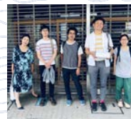
シズオカオーケストラ

静岡をテーマに語らう飲み会「グリーンドリンクス」、文化イベントを訪れる県外客を即席ゲストハウスでもてなす「みんなのnedoco プロジェクト」など、豊かなまち・持続可能なまち・平和なまちに向かうきっかけとなるような企画を仕掛けている。