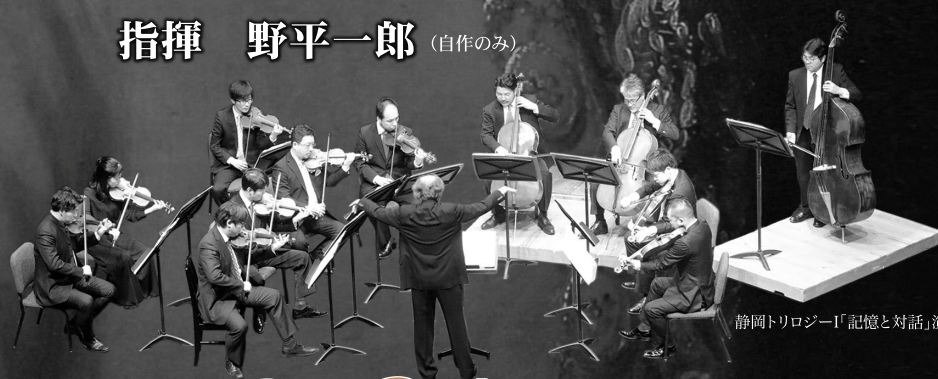
静岡トリロジーI「記憶と対話」演奏の様子