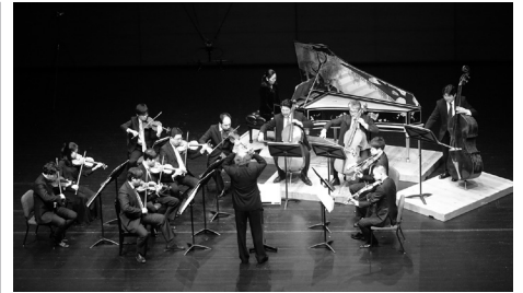
静岡トリロジーI「記憶と対話」演奏の様子