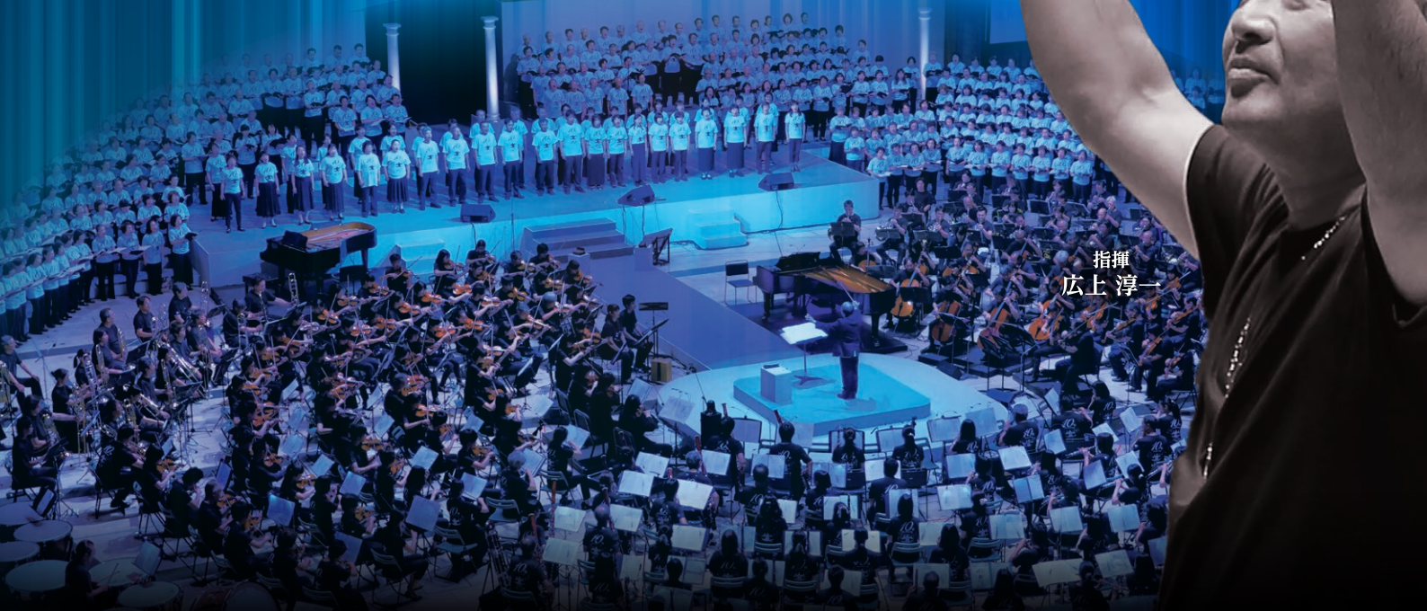
指揮 広上 淳一