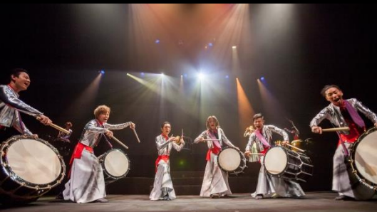
和太鼓グループ 彩