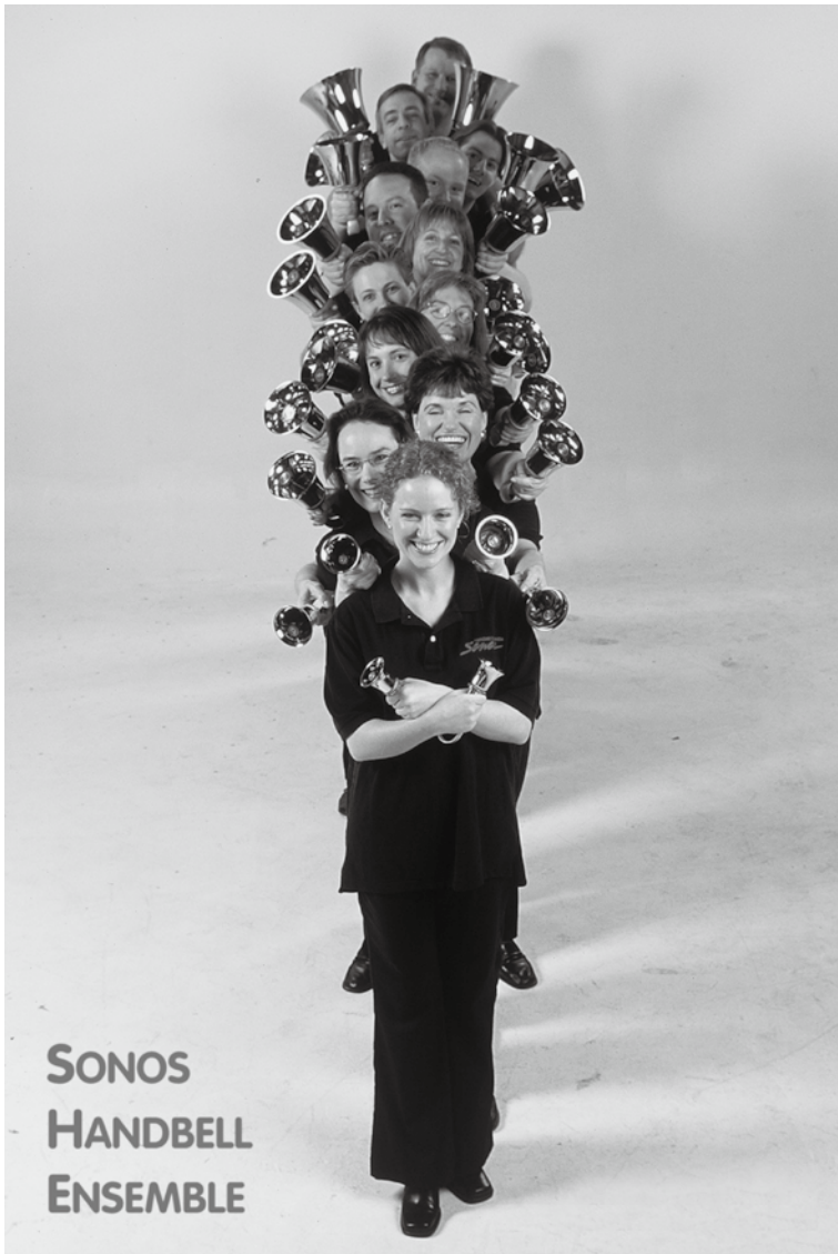
SONOS HANDBELL ENSEMBLE