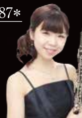
第11回 国際オーボエコンクール・軽井沢 第1位(日本人初)