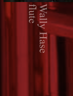
Wally Hase flute