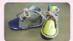
福祉事業所：「友の風」