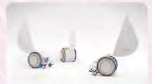
電動アシスト車いす「&Y」

申込・問合せ グランシップチケットセンター TEL.054-289-9000 FAX.054-203-5716 E-mail.info@granship.or.jp